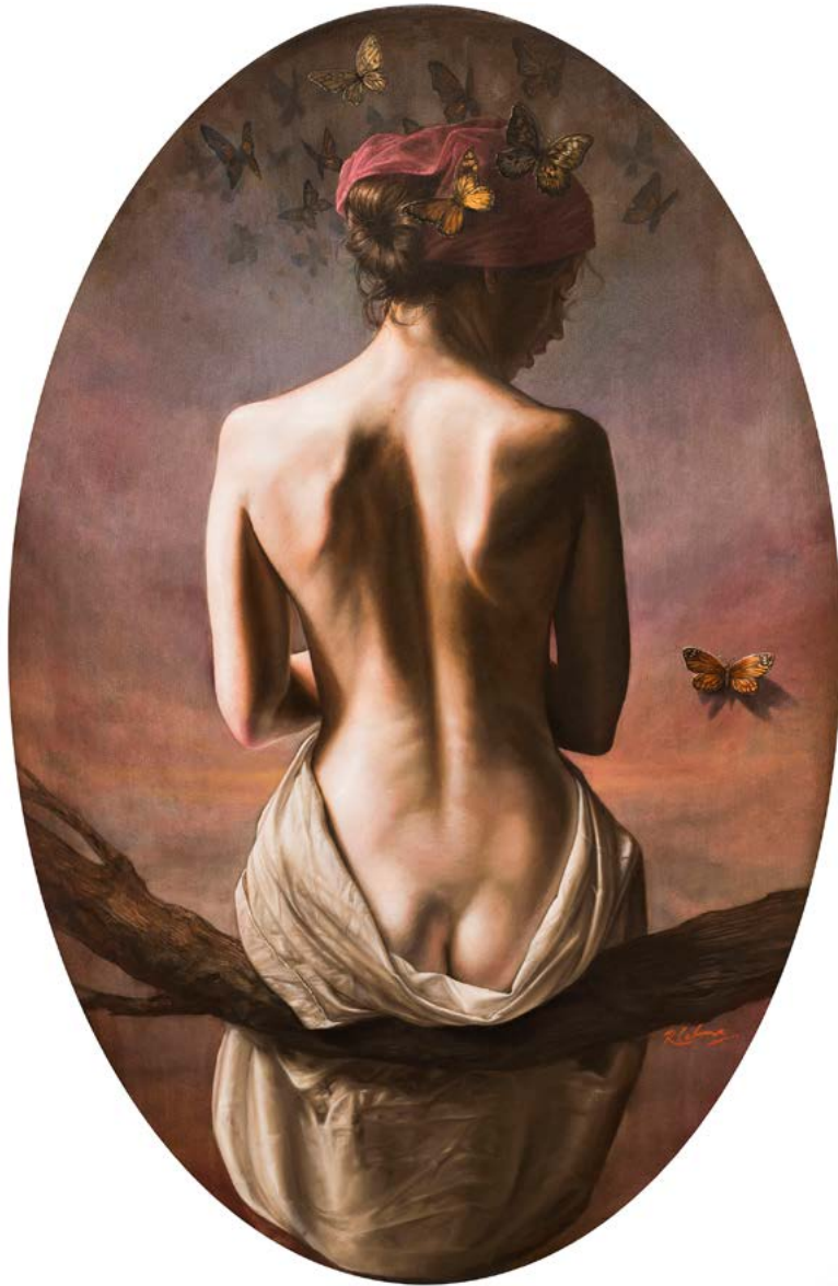
25| EL SUEÑO DE CRISÁLIDA óleo sobre lienzo . 100 X 66 cm . 2019