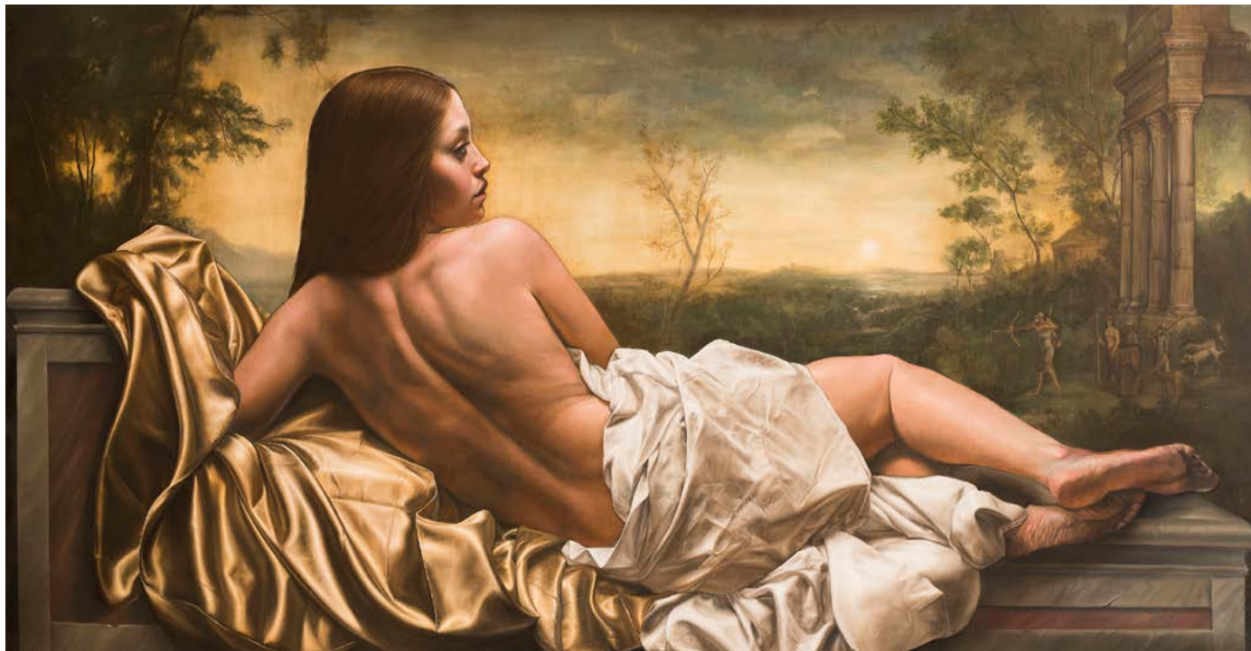
20| EL RETORNO DE ATENEA óleo sobre lienzo . 100 X 200 cm . 2019