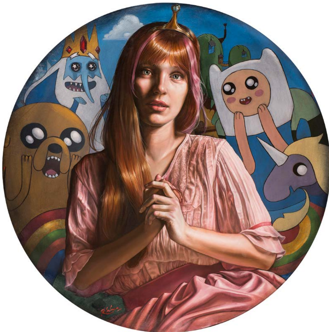
12 | DULCE PRINCESA óleo sobre lienzo . Ø 90 cm . 2018