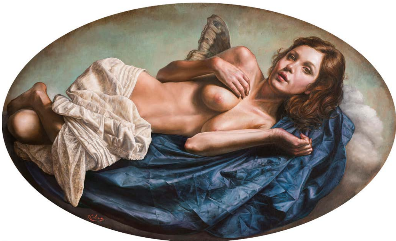
19| EL RETORNO DE PSIQUE óleo sobre lienzo . 59 X 99 cm . 2019