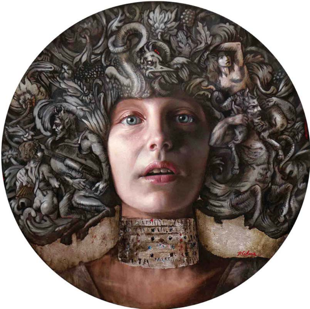
8 | EL DIARIO DE EVA IV óleo sobre lienzo . Ø 50 cm . 2017