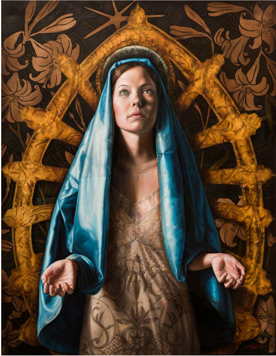
13| VIRGEN DE LUJÁN óleo sobre lienzo . 130 X 100 cm . 2018