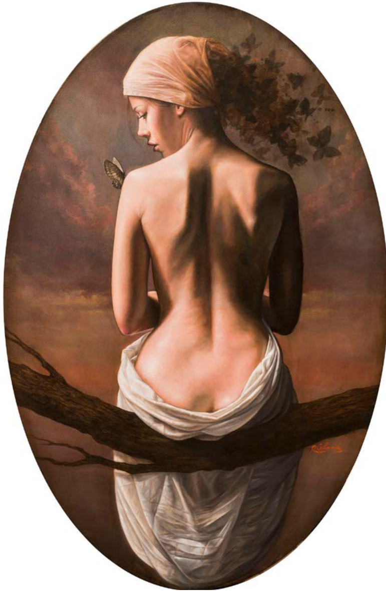
26| EL SUEÑO DE CRISÁLIDA II óleo sobre lienzo . 100 X 66 cm . 2019