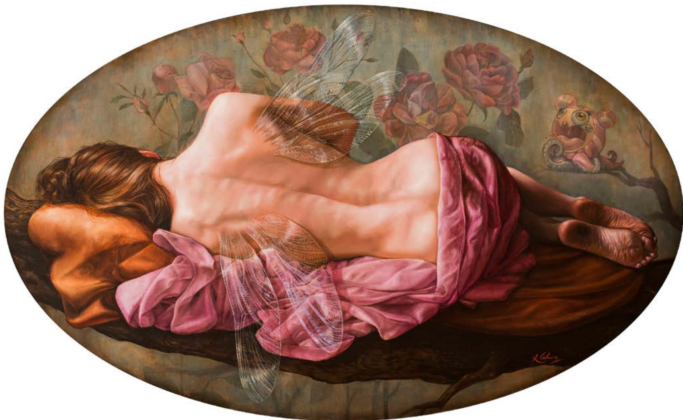
18 | TENTACIÓN DE LA NINFA óleo sobre lienzo . 59 X 99 cm . 2019