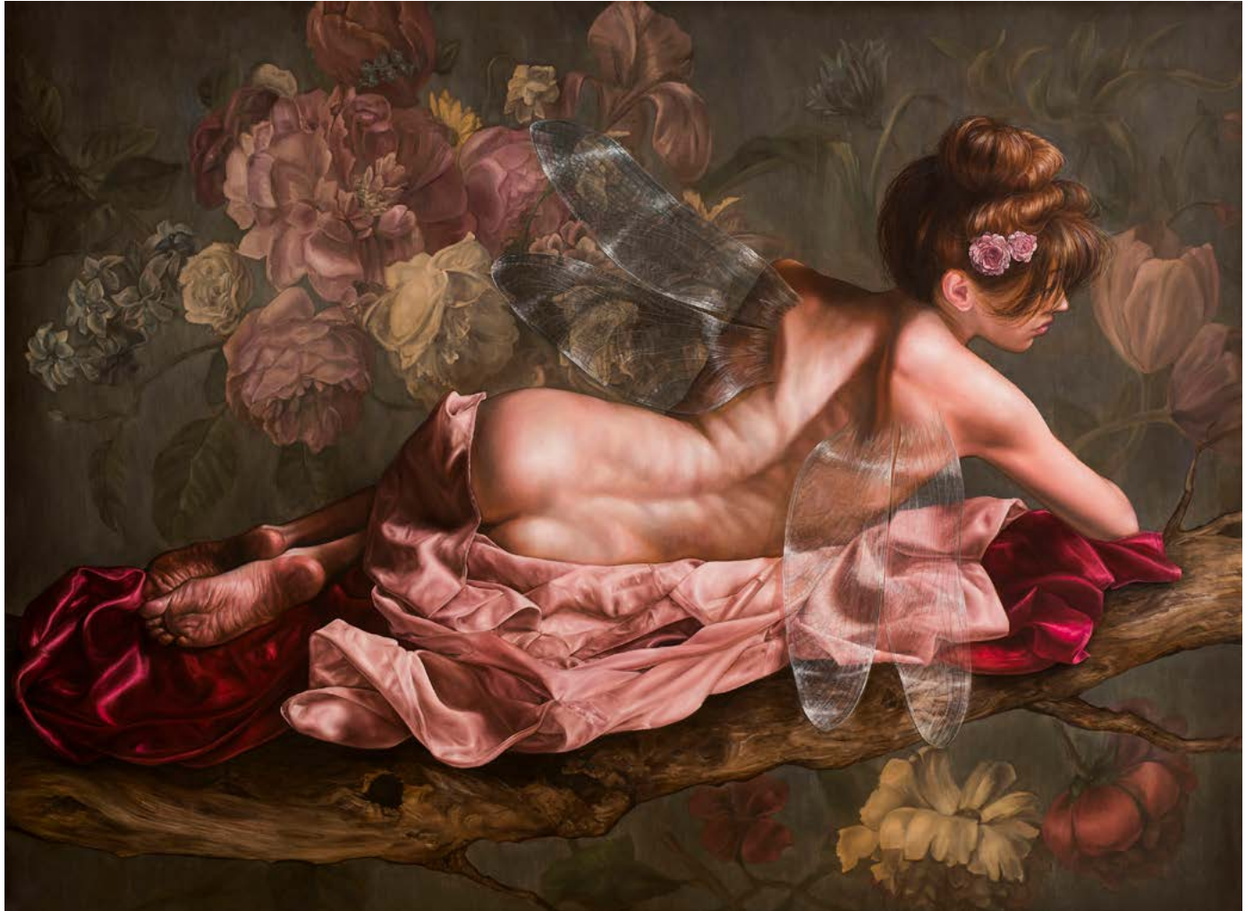
17| HADA EN REPOSO óleo sobre lienzo . 145 X 196 cm . 2019