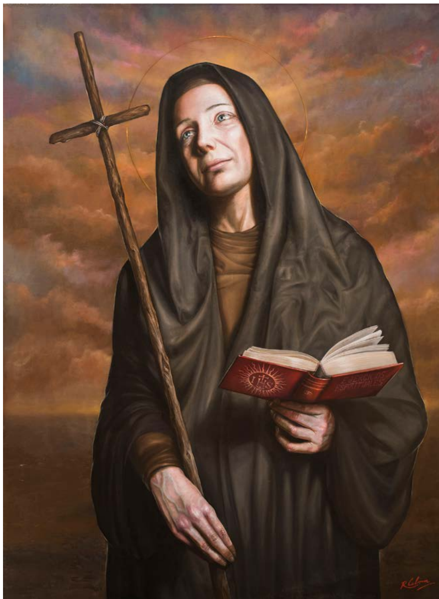
14| MAMA ANTULA óleo sobre lienzo . 120 X 90 cm . 2019