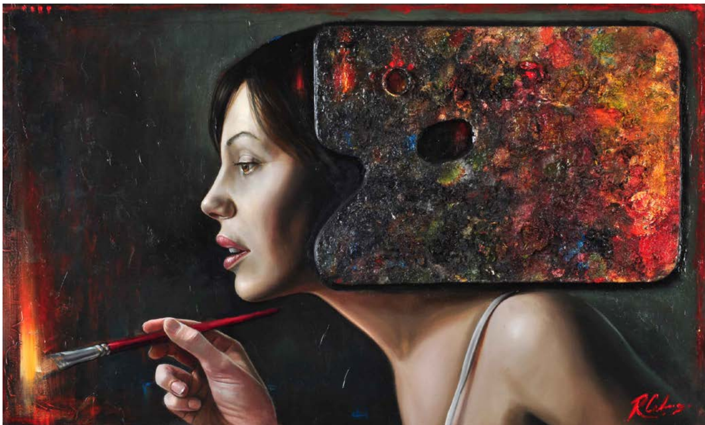
2 | PALETA DE VERANO óleo sobre madera . 45 X 75 cm . 2012