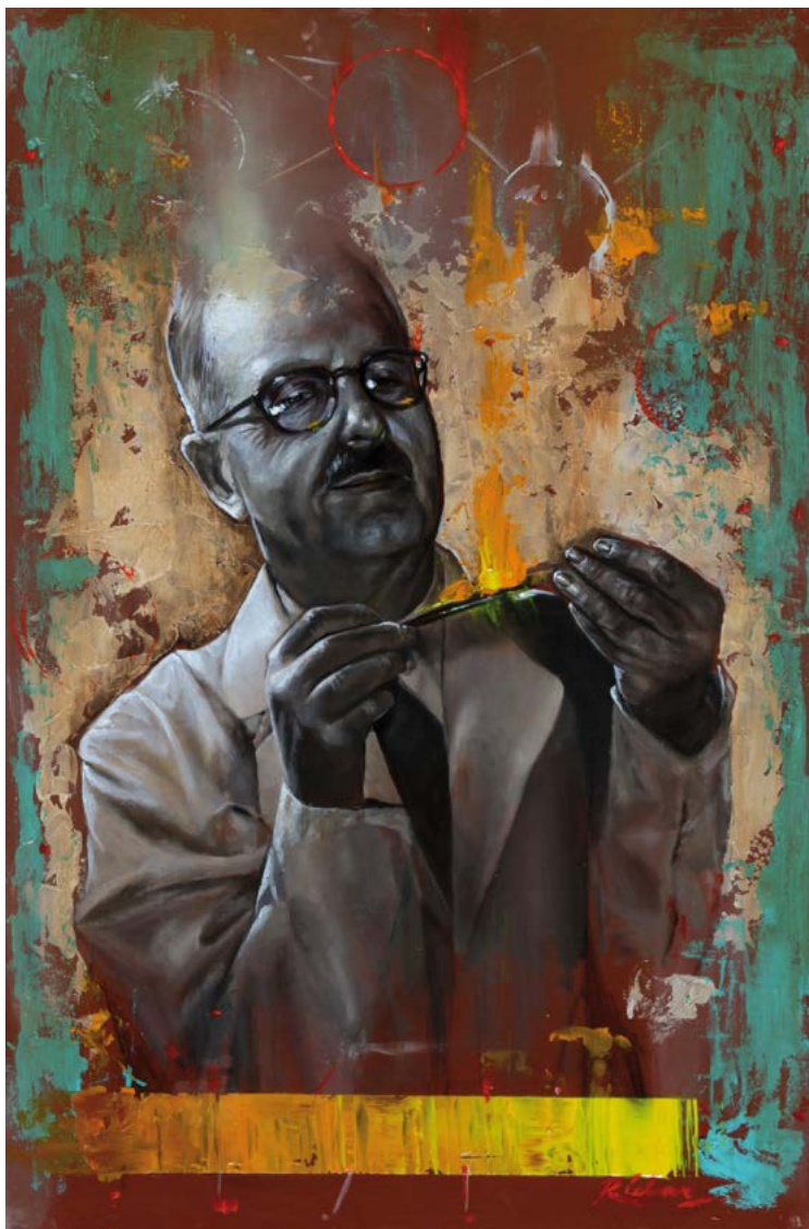
10| BERNARDO HOUSSAY óleo sobre madeira . 60 X 40 cm . 2017