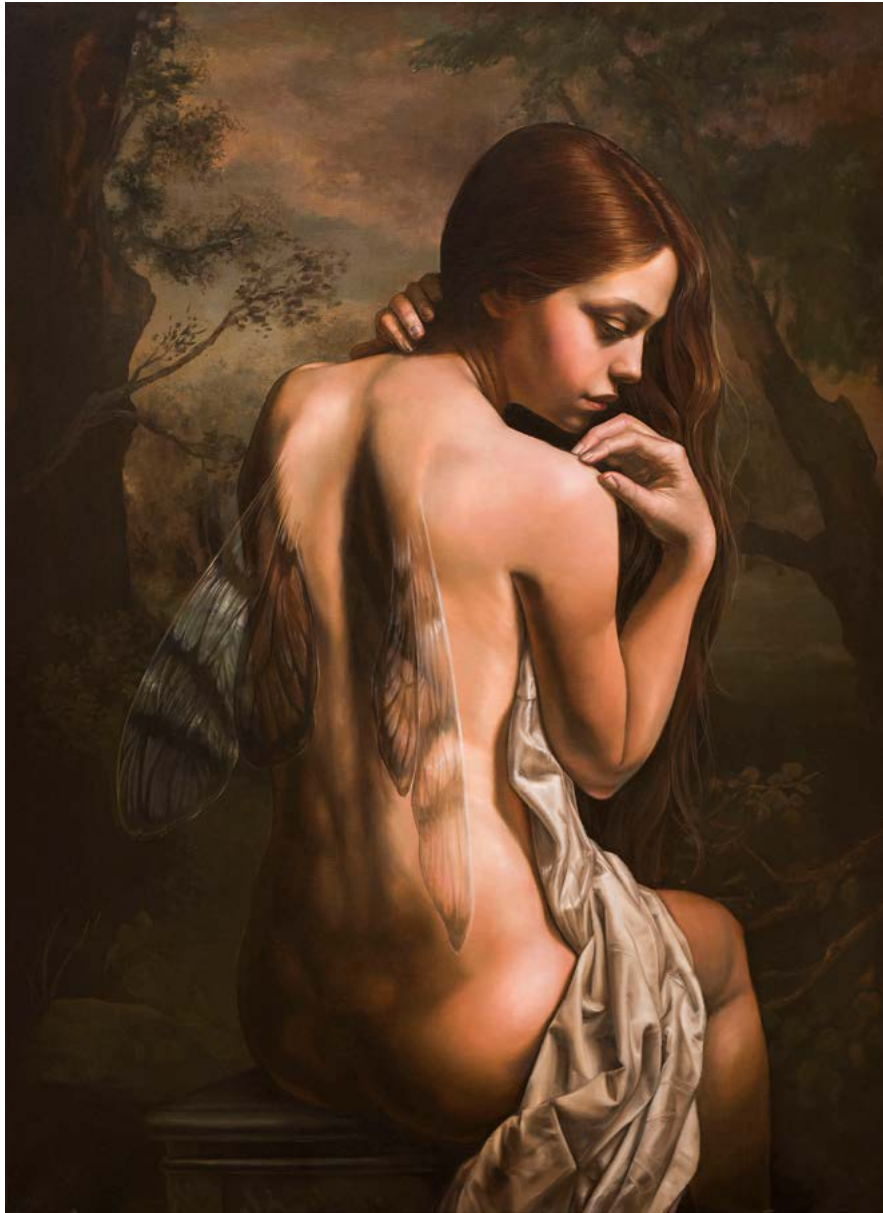
21 | EL CREPÚSCULO DE LA NINFA óleo sobre lienzo . 123 X 90 cm . 2019