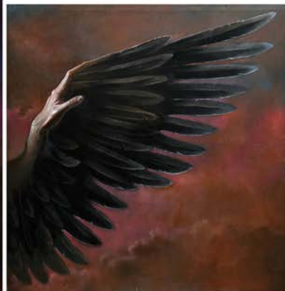
11| CÓNDOR ANDINO . tríptico . óleo sobre lienzo . 250x260 cm . 2017