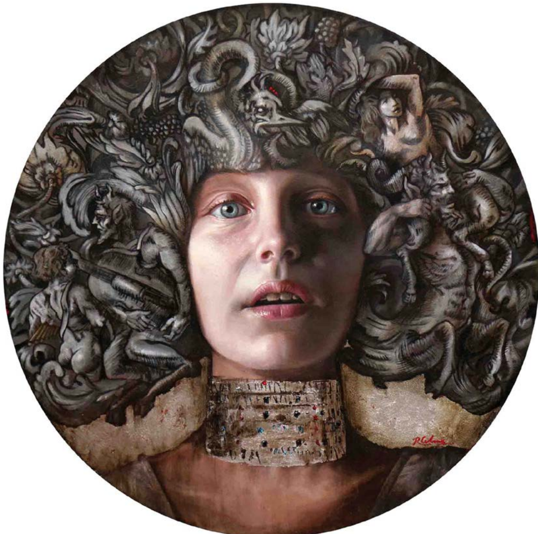
10 EL DIARIO DE EVA IV . óleo sobre lienzo . ø 50 cm . 2017