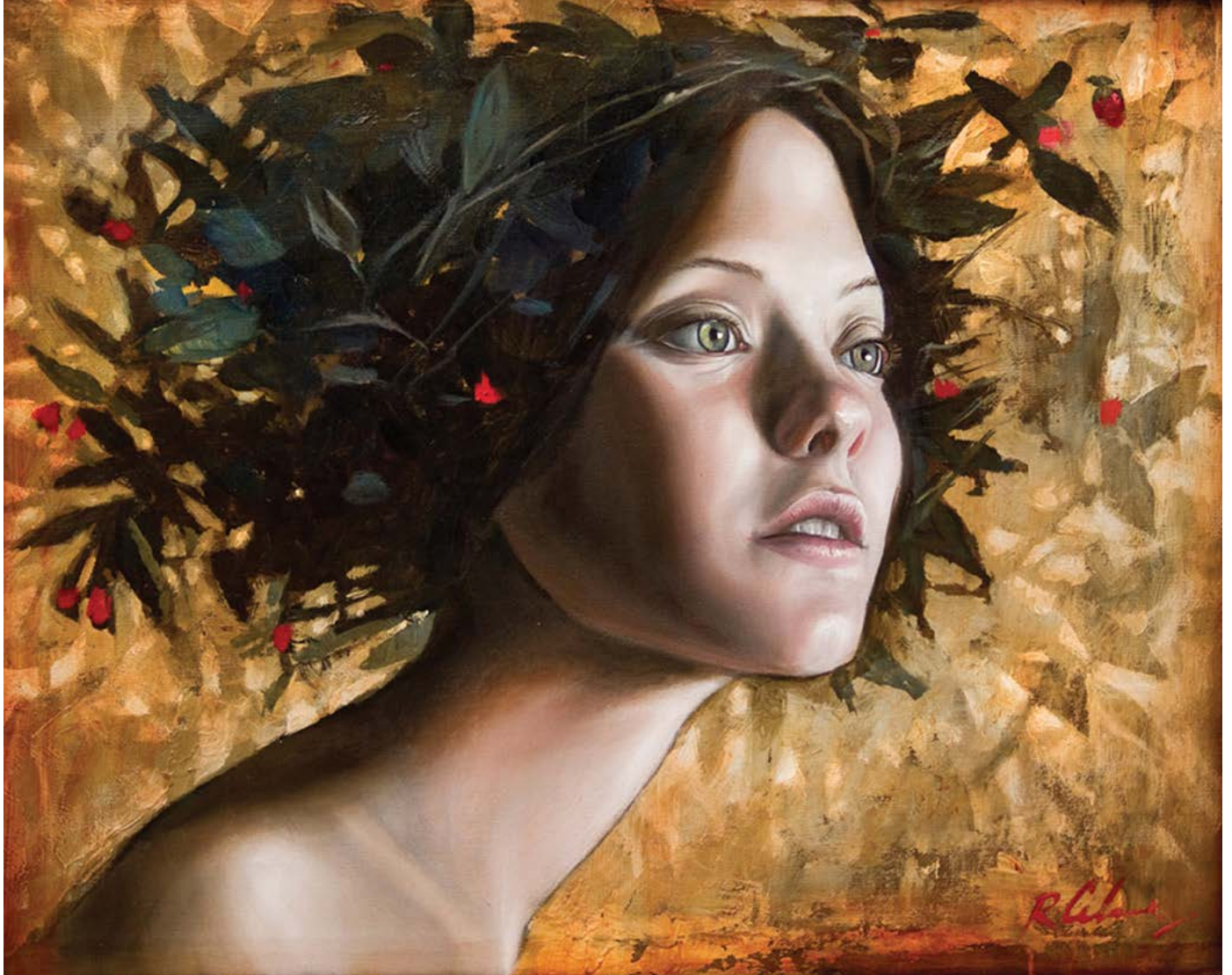
4 | MUJER FLORAL II . óleo sobre madera . 45x55 cm . 2015