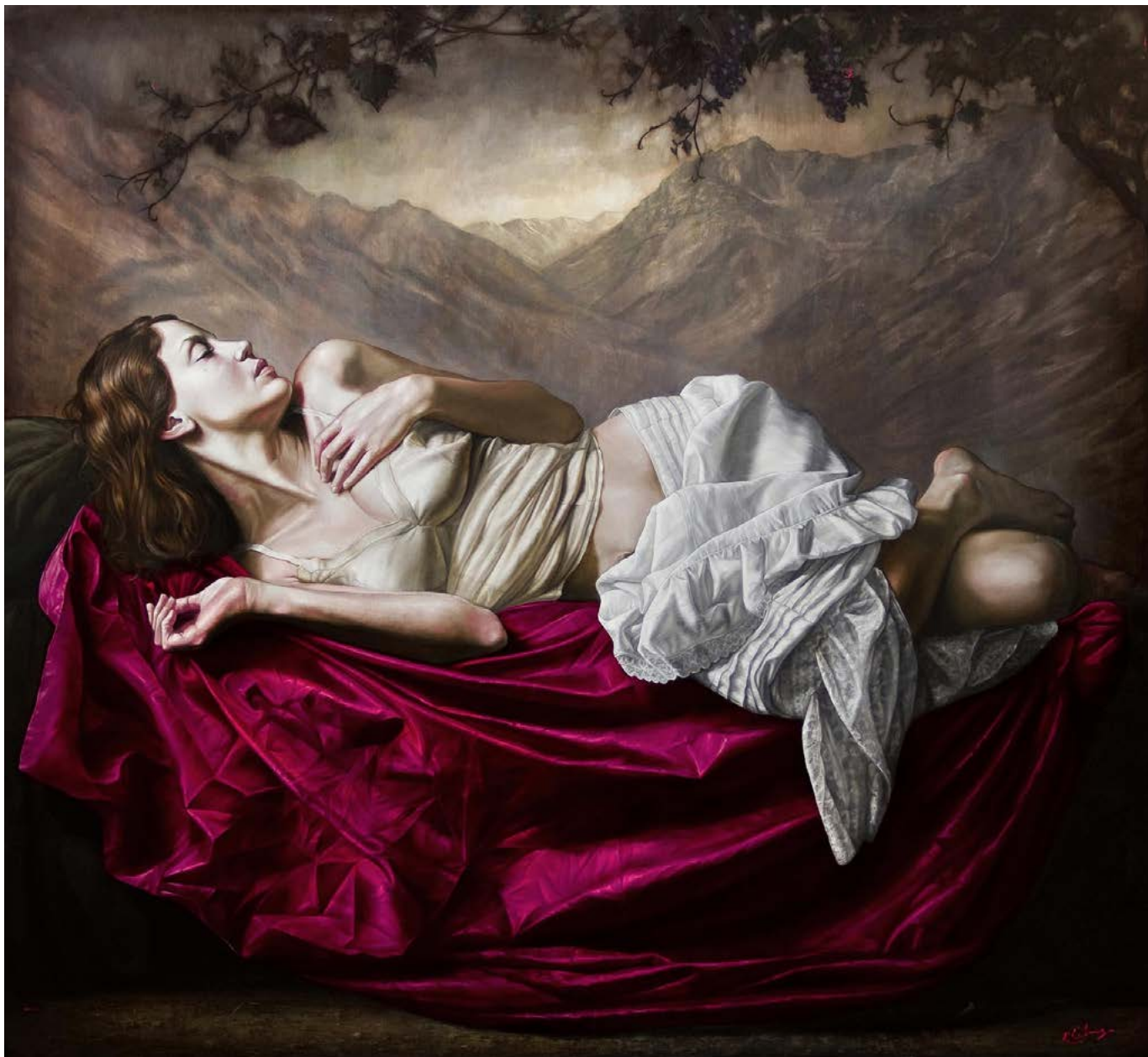
3| SIESTA EN LAS PARRAS . óleo sobre lienzo . 150x160 cm . 2013