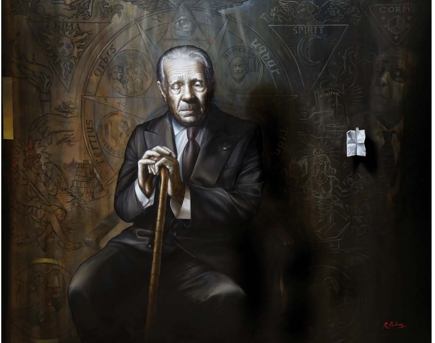
71 EL OTRO BORGES . óleo sobre lienzo . 127x158 cm . 2017