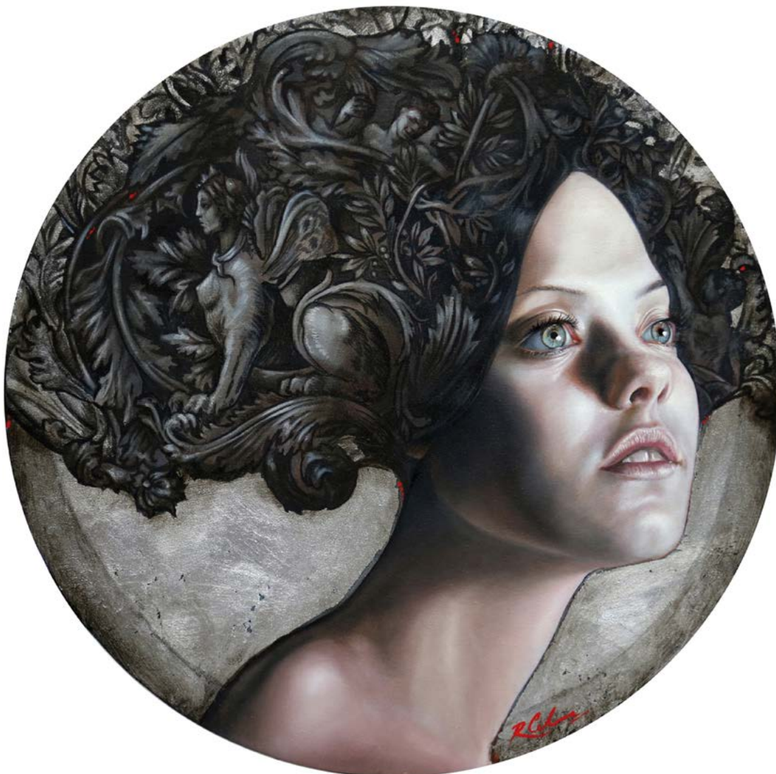
9 | EL DIARIO DE EVA I . óleo sobre lienzo . ø 50 cm . 2017