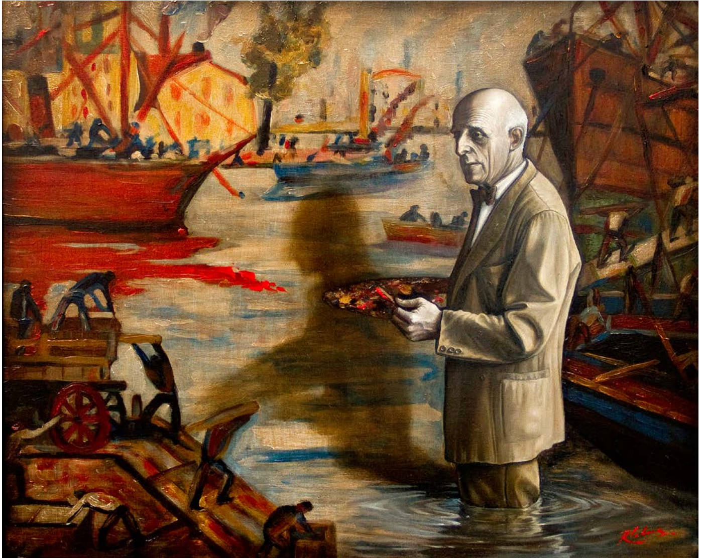
5 | HOMENAJE A QUINQUELA MARTÍN . óleo sobre madera . 44x55 cm . 2015