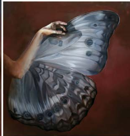
8| NINPHALIDAE ARGENTINUS . tríptico . óleo sobre lienzo . 250x250 cm . 2017