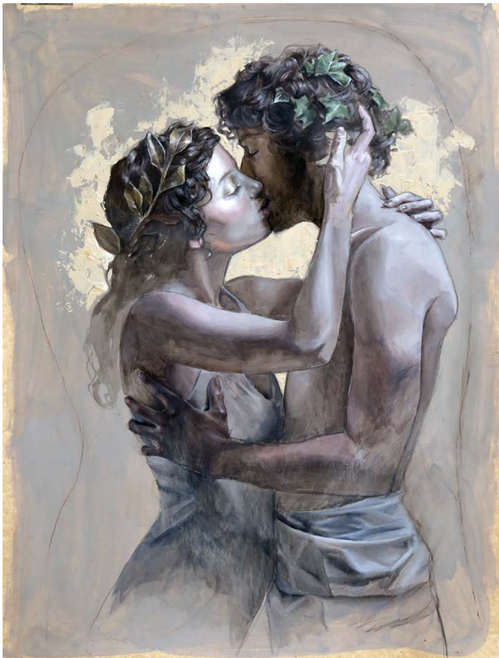
13 BESO DE PAPEL II . acrílico sobre cartulina . 100x75 cm . 2017