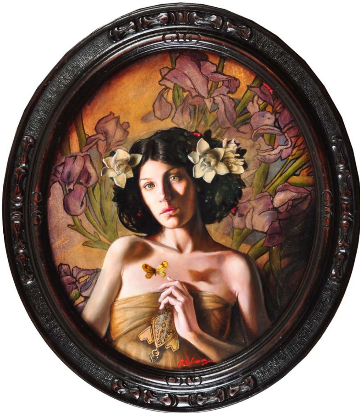
2 | JARDÍN DE LIRIOS . óleo sobre madera . 37x30 cm . 2012