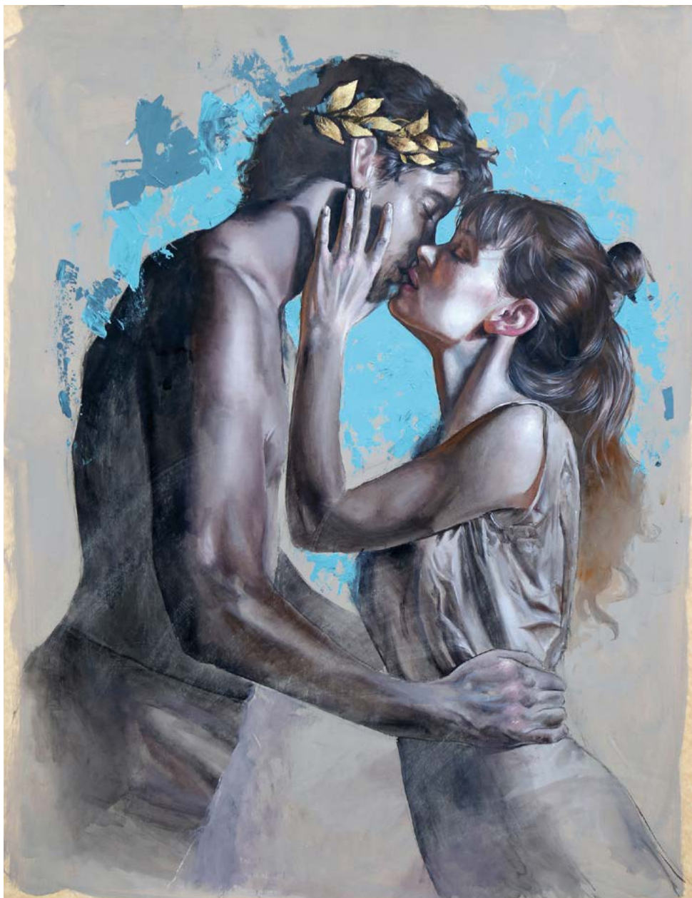
12| BESO DE PAPEL I . acrílico sobre cartulina . 100x76 cm . 2017