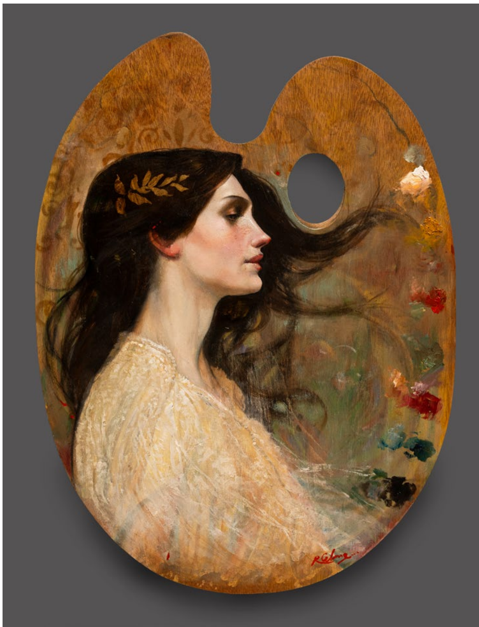
PALETA DE VERANO óleo sobre madera . 40 x 30 cm . 2023