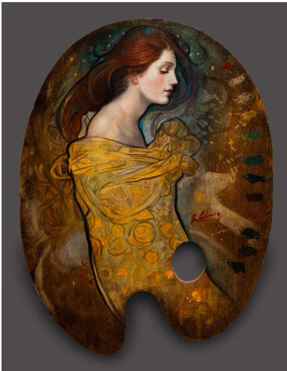
PALETA DE PRIMAVERA óleo sobre madeira . 40 x 30 cm . 2023