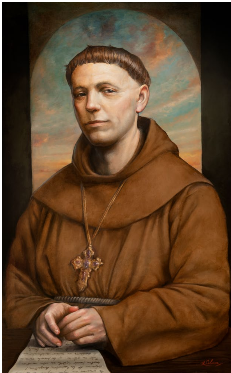
FRAY MAMERTO ESQUIU óleo sobre lienzo . 100 x 60 cm . 2023