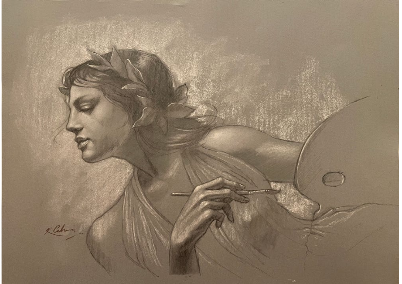
ESTUDIO DE MUSA II lápiz sobre cartulina . 29 x 39 cm . 2023