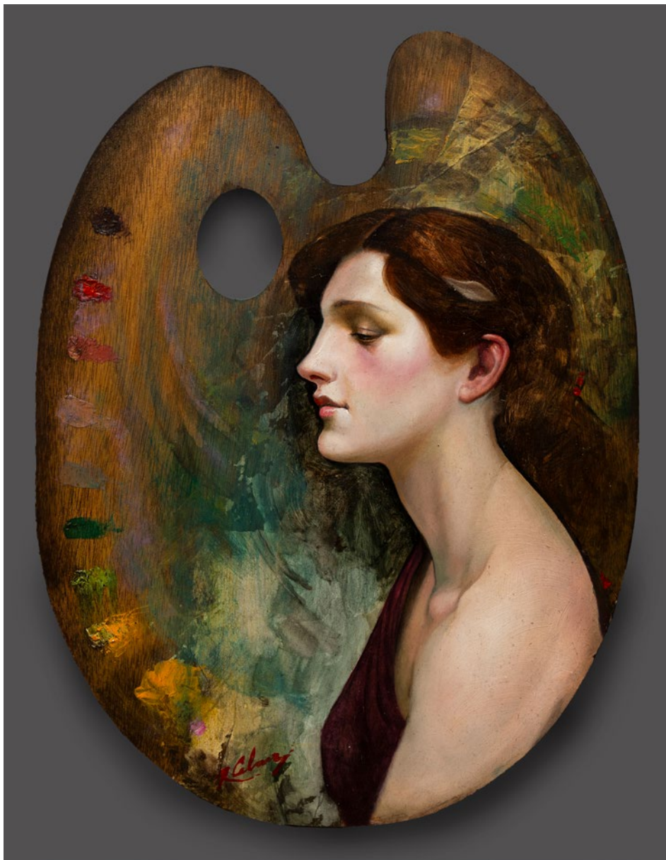
PALETA DE INVIERNO óleo sobre madera . 40 x 30 cm . 2023