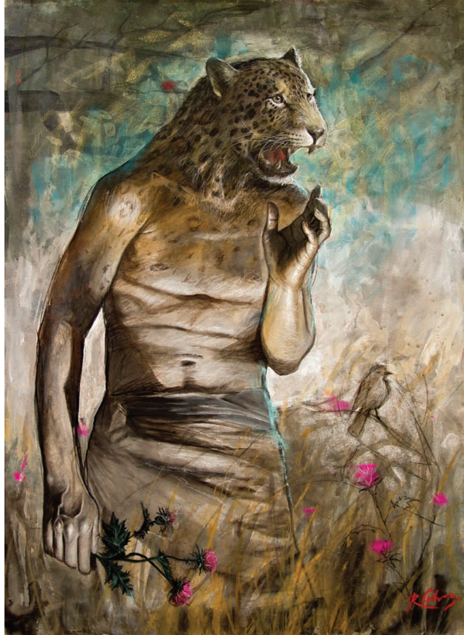
11 Flor de Cardo