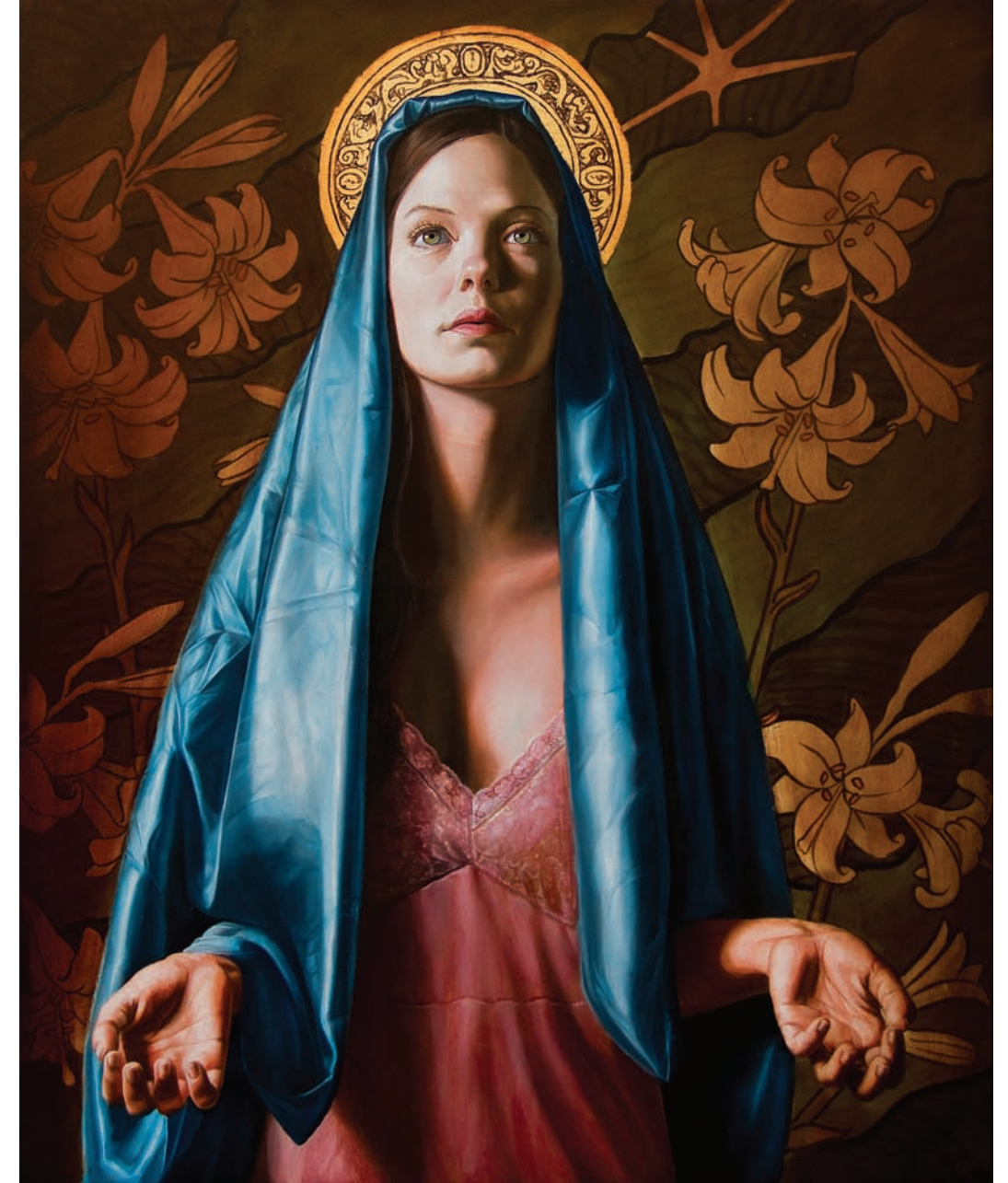
8 Virgen de la Anunciación