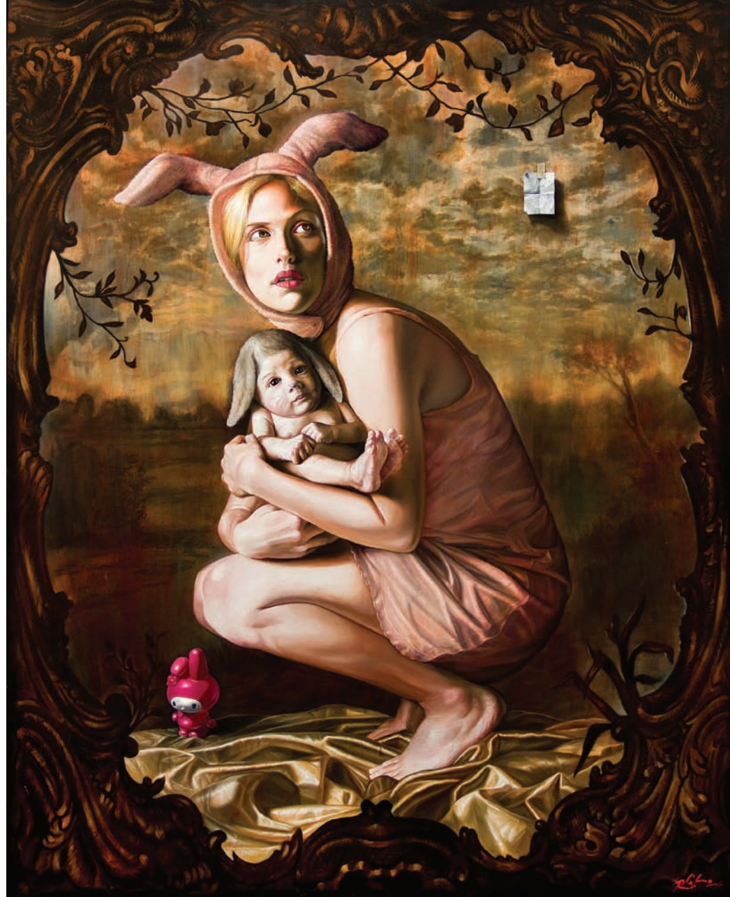
7 La Mara