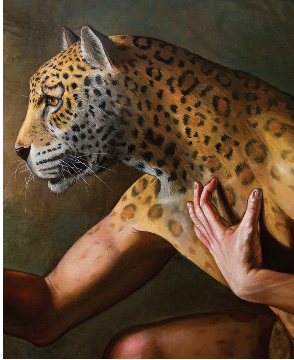
4 Ceres y el Yaguareté