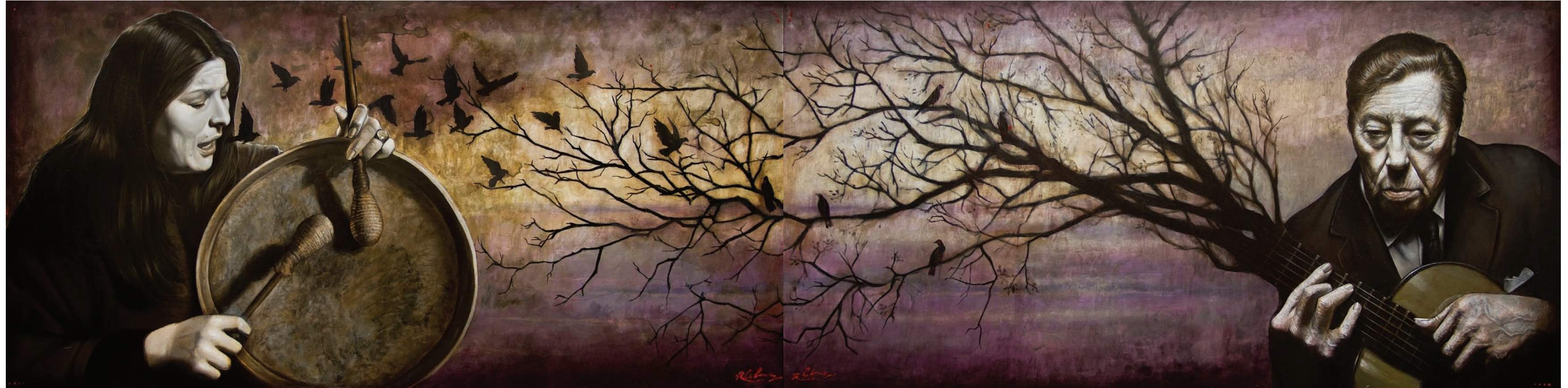
9 Mercedes y las Aves