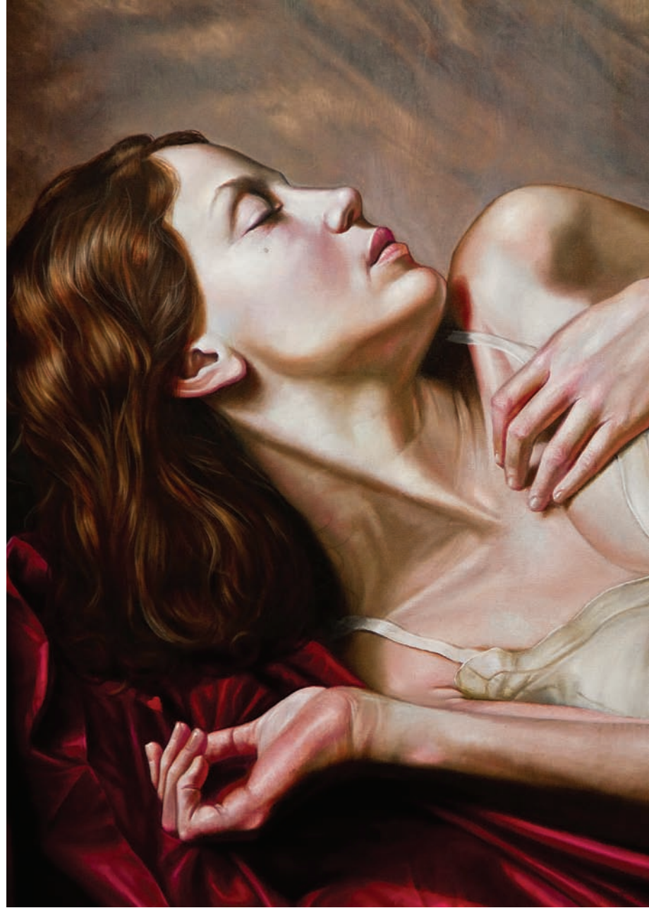
6 Siesta Bajo las Parras